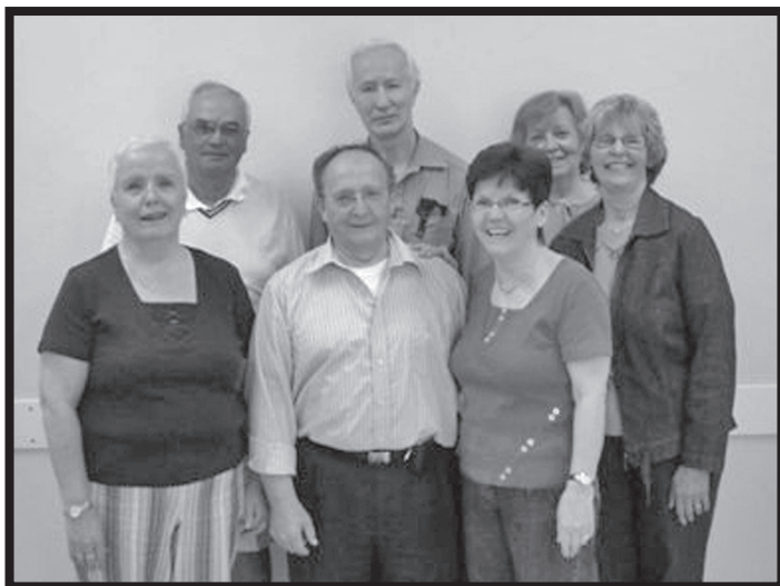
Comité directeur 2009-2010