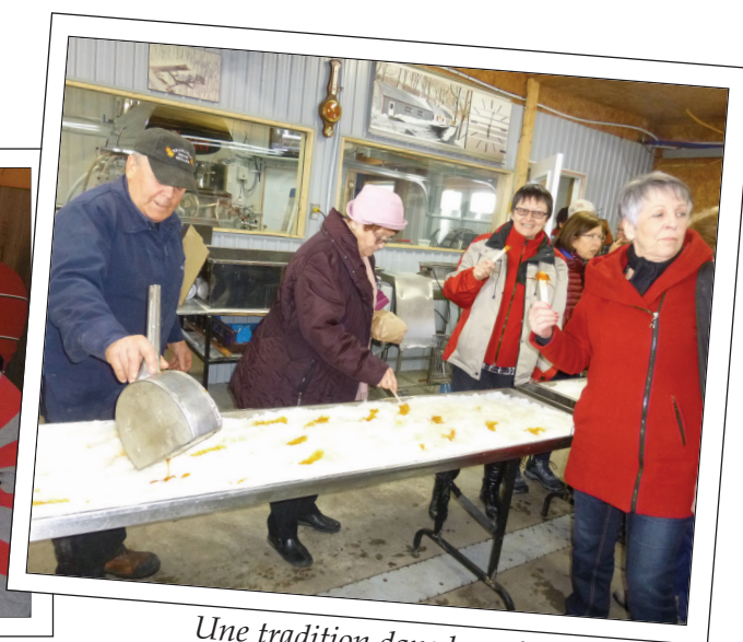
Une tradition dans les cabanes à sucre : la dégustation de la tire sur la neige.