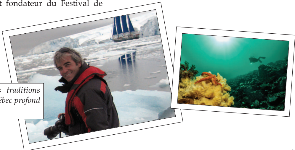
Arctique, la dérive des traditions (photo à gauche) et Québec profond (photo à droite).

Nous avons dîné sur place en commandant des boîtes à lunch au marché Richelieu. Le retour à Québec s'est fait vers 14h. Les personnes qui ont vécu cette expérience ont bien apprécié cette formule. Nous tenons à remercier le Conseil régional pour son ouverture à permettre aux membres du comité régional en environnement d'assister à ce festival.