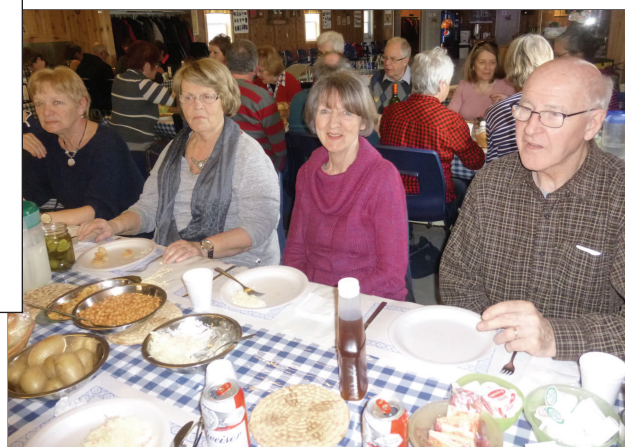
On a vidé nos assiettes. Les mets étaient sucrés mais succulents...