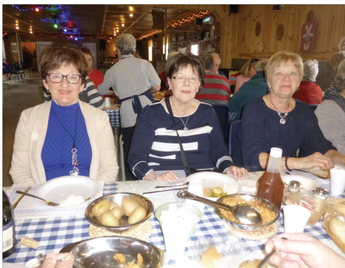
Une belle assistance à la cabane à sucre à Saint-Stanislas.