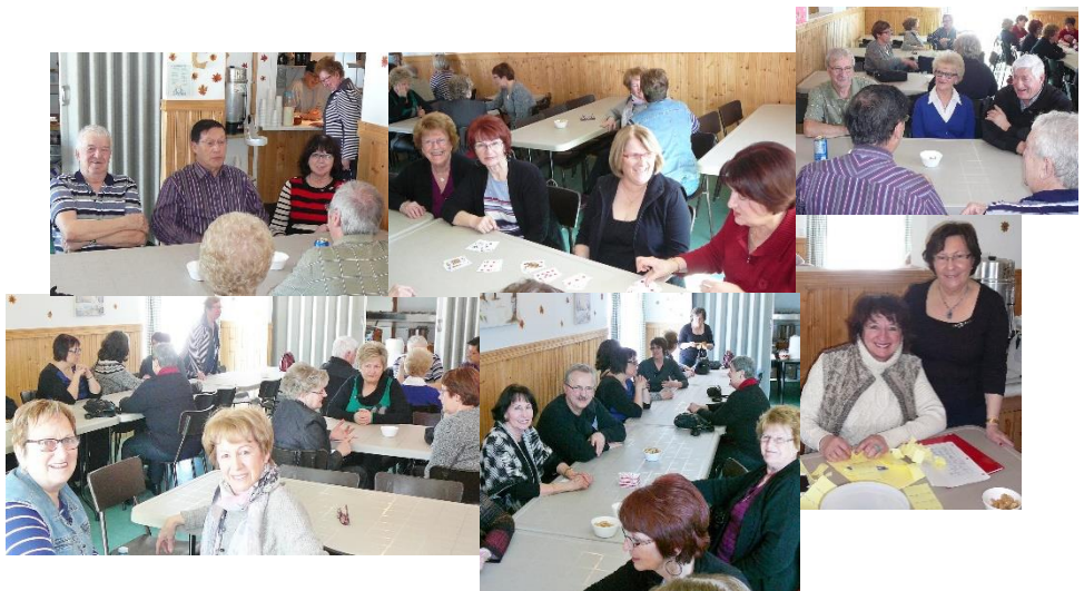
Les becs sucrés en action à Saint-Jogues!!!