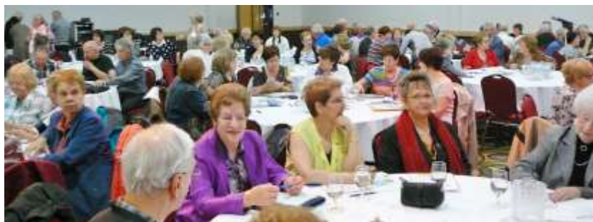
Assemblée générale régionale

La présente édition de l'Arc-en-Ciel parvient à plus de 268 membres via Internet. Ceux-ci noteront une nouvelle adresse d'expédition journal-arc-en-ciel@outlook.com qui servira essentiellement à l'envoi du journal. Vous voudrez bien communiquer avec vos représentants aux adresses habituelles (voir pages 6 et 7). Ceux et celles qui désirent ajouter leur nom à notre liste d'envoi par courriel peuvent communiquer avec realetmonique@hotmail.com