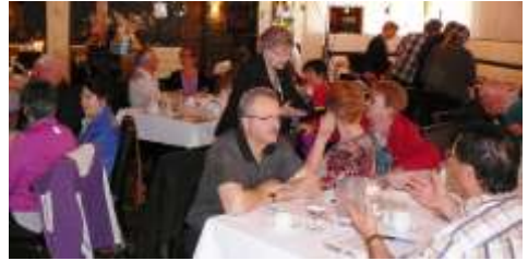
Assemblée de secteur