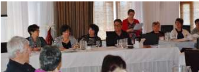
Assemblée générale de secteur