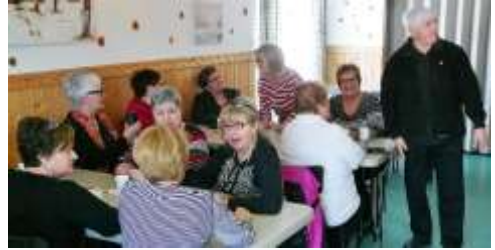
Cabane à sucre, Saint-Jogues