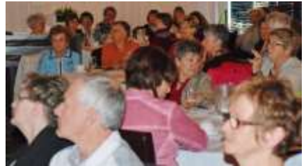
Assemblée de secteur