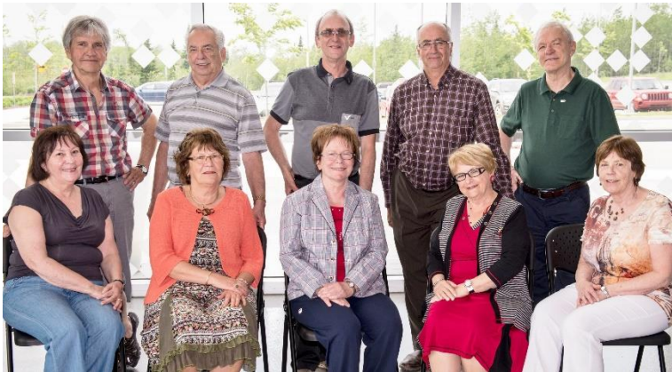
Membres du comité exécutif régional