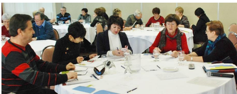
Membres du conseil sectoriel Baie-des-Chaleurs en réunion