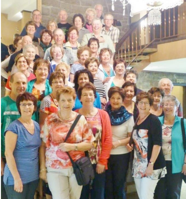
Voyage à New-York, mai 2014

Toute personne intéressée doit l'indiquer avant le 31 janvier par courriel à arerg01c.gh@globetrotter.net ou au 364-7463. Vous recevrez alors une copie du programme détaillé. Le voyage se fera s'il y a un nombre suffisant de participants.