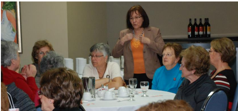
Diner de la moisson à New-Richmond