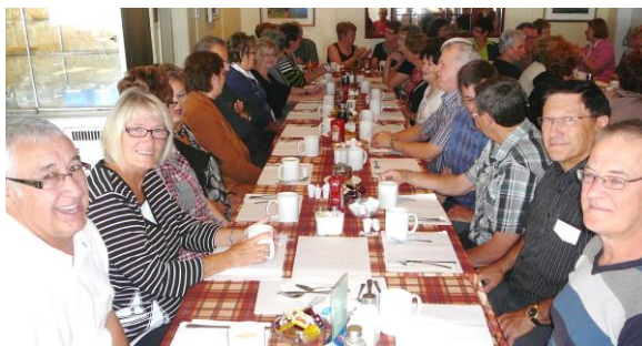
Déjeuner de la 'bonne humeur' à Paspébiac