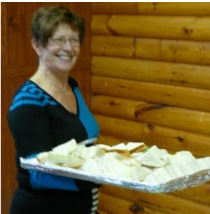
Le dîner est servi!

La participation dynamique et les commentaires formulés à la suite de cette journée d'activités variées incitent les responsables à évaluer sérieusement la pertinence de répéter l'expérience avec des sujets différents.