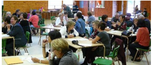
On participe activement! ↑ ← Petit rallye-recherche pour prendre l'air! Des membres intéressés et intéressants! ↓