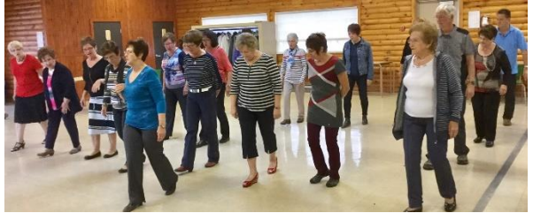
Une petite danse en ligne comme détente!