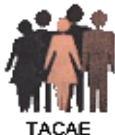
Table d'action contre l'appauvrissement de l'Estrie (TACAE) BILAN DE LA JOURNÉE DU 2 DÉCEMBRE 2019

Cette journée, organisée conjointement par le Collectif pour un Québec sans pauvreté et la TACAE, avait pour thème :