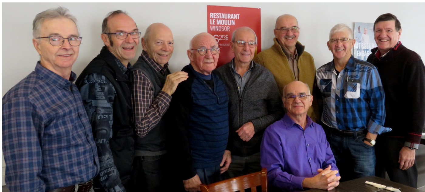
Déjeuner des hommes, le 21 novembre 2018