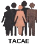
Table d'action contre l'appauvrissement de l'Estrie (TACAE)