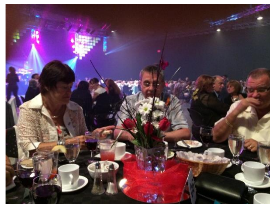
Assemblée générale Fondation Laure-Gaudreault