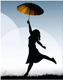
Calacs de Charlevoix