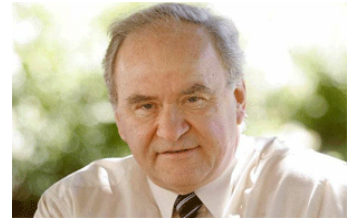
Conférencier hors pair