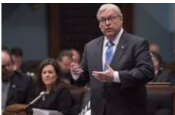
4 décembre 2017 | Jean Philippe Angers - La Presse canadienne Le ministre de la Santé, Gaétan Barrette