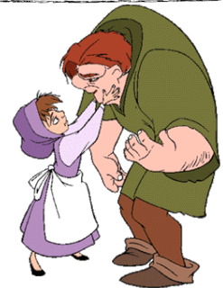
Le Bossu de Notre-Dame