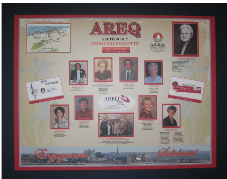
Tableau du secteur 01 F