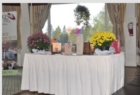
Des prix de présence en grand nombre.