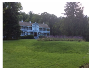
La Maison de Pointe Platon