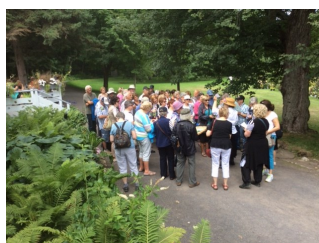
Échanges entre experts...