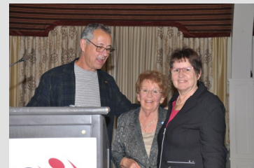
Bonne récolte pour le fondation Laure-Gaudreault.