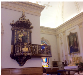
Le sermon fut bref !