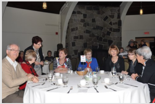
La table est bonne et on est heureux de se revoir.