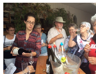
On ne se laisse pas prier pour goûter le cidre ...