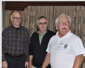
Le club des ex présidents.