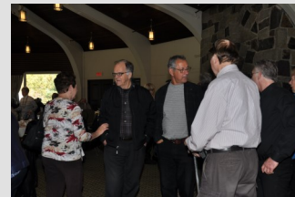
Certains discutent plus sérieusement.