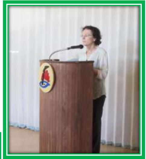
UN MOT DE BIENVENUE