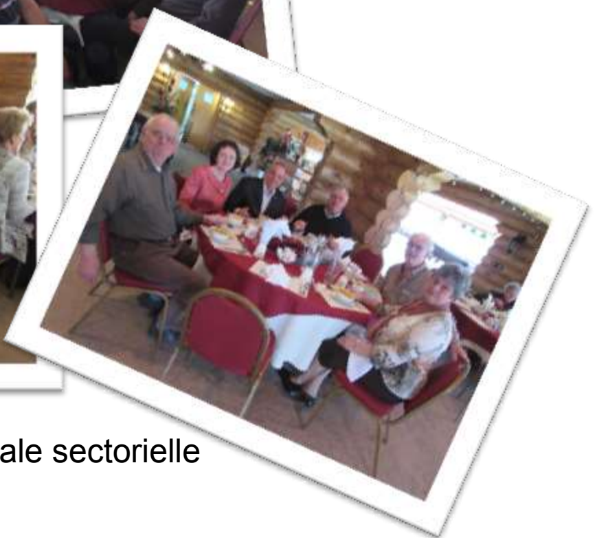
L'Assemblée générale sectorielle