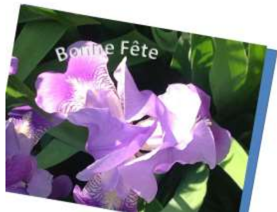
iris 2015 gINETTE Labrosse