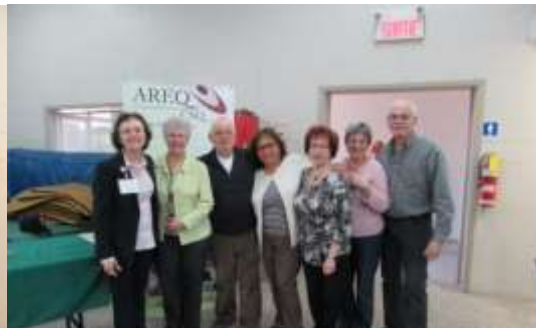
L'équipe qui reconnaît que l'important, c'est de participer.